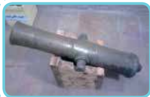
نمونه‌ای از توپ جنگی دوره نادر