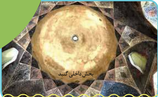
بخش داخلی گنبد