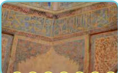
آیات قرآن پیرامون سالن اصلی

این بنا هر چند «کاخ» خوانده می‌شود، ولی دلیل احداث آن به درستی مشخص نیست. بسیاری آن را محل نگهداری گنجینه‌ها و غنائم جنگی نادر می‌دانند و برخی به دلیل وجود سردابی بزرگ و کتیبه‌ای از سوره نباء که به آخرت و زندگی پس از مرگ اشاره دارد، آن را آرامگاهی تصور می‌کنند که نادر قصد داشته است برای خود بسازد. لازم به یادآوری است، سرداب کاخ که محلی کاملاً سرد و خنک است، احتمالاً برای دفن نادر در نظر گرفته شده بود. در دوران قاجار، از این سرداب به عنوان زندان استفاده می‌شد. این بنا در سال ۱۳۱۸ به عنوان یکی از آثار ملی ایران به ثبت رسیده است. در حال حاضر در طبقه پایین این کاخ، موزه‌ای حاوی مجسمه‌هایی از آیین‌ها و سنت‌های مردم کلات دایر است.