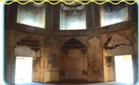
فضای هشت ضلعی

زیرزمین کاخ خورشید از دو قسمت تشکیل شده است: ابتدا یک فضای هشت ضلعی که درست زیر هشت ضلعی بالایی، یعنی زیر هم‌کف قرار دارد و دارای چهار ستون است. پیرامون این ستون‌ها و اتاق‌ها راهروهایی قرار دارند. بر اساس یافته‌ها به نظر می‌رسد که عمارت خورشید بر بقایای یک بنای دیگر و احتمالاً روی یک مقبره ایلخانی ساخته شده باشد. همچنان که می‌دانیم، ایلخانان در ساخت بناهای چندضلعی بسیار ماهر بودند و آثار چندی از سازه‌های چندضلعی از آنان برجای مانده است.